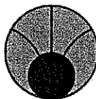
STREFA ZAGROŻENIA PROMIENIOWANIA ELEKTROMAGNETYCZNEGO