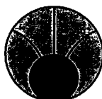
STREFA ZAGROŻENIA PROMIENIOWANIA ELEKTROMAGNETYCZNEGO